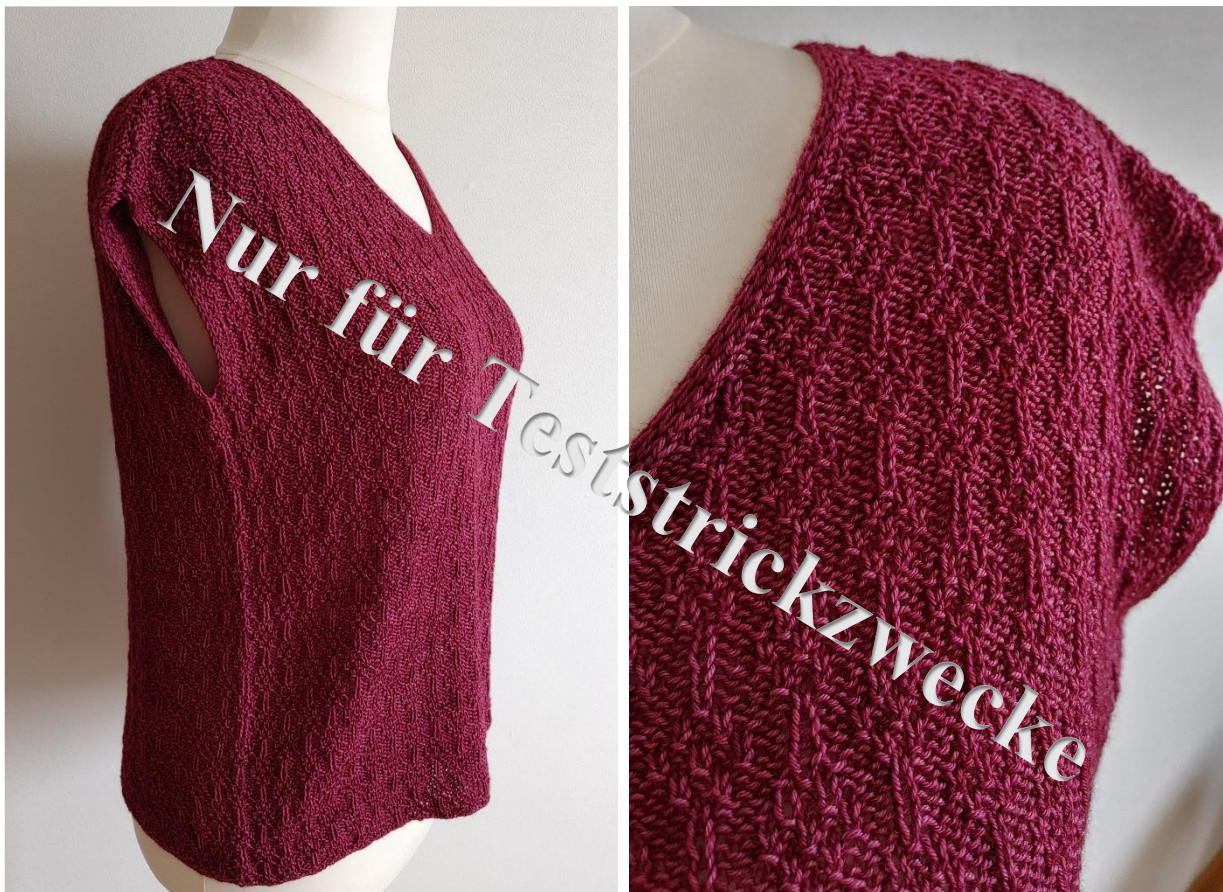
Venner – Teststrick 2023 Alle Bilder, Text und Illustrationen ©Silke Ufer Design.

Sonstiges: 2 Marker, einer davon andersfarbig für den Rd-anfang, 2 herausnehmbare Marker, Garnreste, Stopfnadel, Maßband.